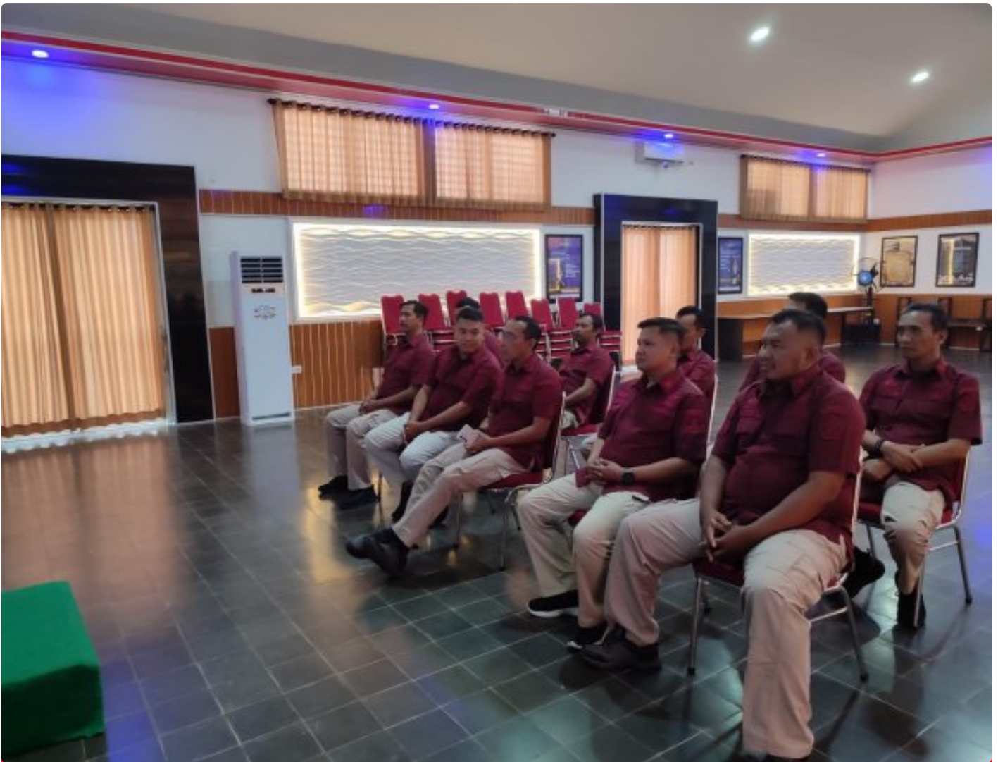
Bangun Personal Branding ASN, Lapas Besi Hadiri Webinar Series 6

CILACAP – Petugas Lapas Kelas IIA Besi Nusakambangan menghadiri kegiatan Webinar Series 6 yang diselenggarakan oleh Badan Pengembangan Sumber Daya Hukum (BPSDM) dan HAM bertempat di Aula Wijaya Kusuma, Kamis (24/10/2024).